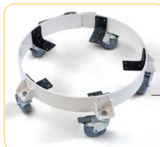
Embases à roulettes