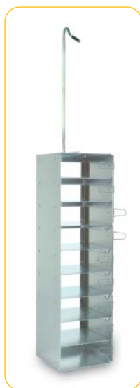
Rack 9 étages