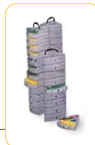
Rack à tiroirs pour Arpeges 55 et 75