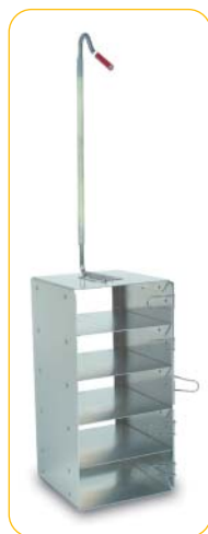
Rack 5 étages