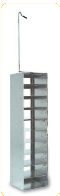
Rack 10 étages