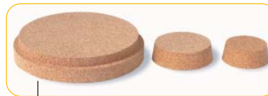
Bouchons pour AGIL