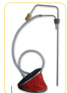
Système de soutirage