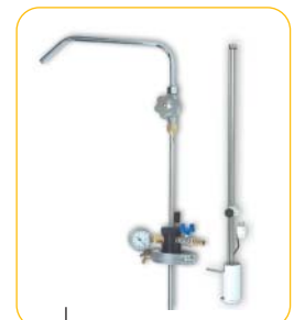
Pompes PC 250 + DL3