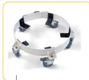
Embases à roulettes